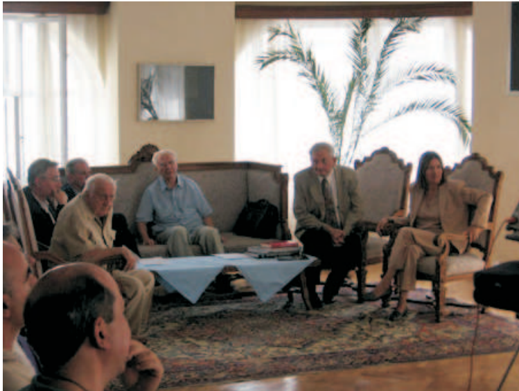
Istaknuti gosti skupa