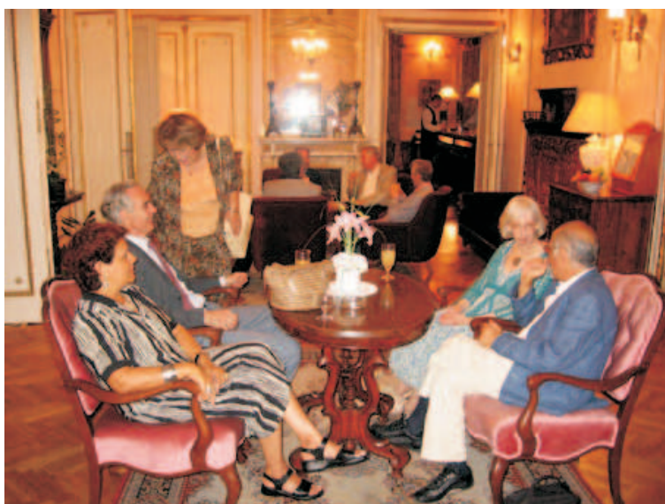
Gosti skupa pred svečanu večeru