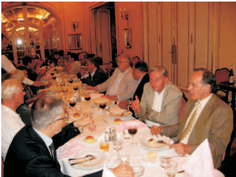
Svečana večera za goste skupa