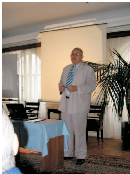
akademik Ivan Gutman