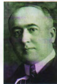
Dr. Milanković Milutin