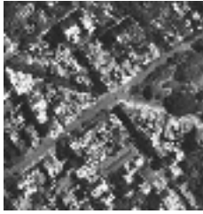
Figura 5: Densificación del tejido '70-'80