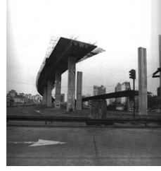
Figura 6: Autopista inconclusa