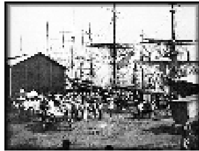
Figura 4: Puerto de Buenos Aires 1885