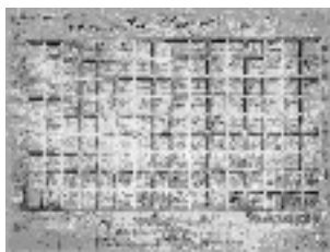
Figura1: La traza fundacional

Escuchamos habitualmente hablar de leguas, cuadradas, varas, loteo fundacional, todas ellas herramientas ideales al momento de definir partes de un todo, mensuras indispensables en el reparto de un activo. Y en tanto la regla simple reparte el la pertenencia, aparece ese espacio público primigenio, exclusivamente de tránsito y mercadeo (la Plaza Mayor de Buenos Aires como lugar del intercambio comercial), construido en términos de isometría; La manzana original como muestra elemental para la repetición, el vacío como confirmación de la rítmica, la línea como indicador de rumbos, el cruce ortogonal como posibilidad acotada de opción.