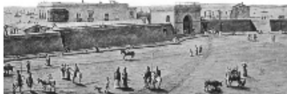
Figura2: Fuerte de Buenos Aires