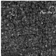
Figura 7: Buenos Aires SXXI

La ciudad y sus senderos, fachada y medianera, el frente como tamiz y filtro entre prácticas, entre la insinuación y el ocultamiento, exacerbado quizá hasta algún modelo de histeria urbana. La ciudad de los planos verticales como producto de la densificación en altura. Composiciones simétricas y constantes, siempre mas cerca de la modulación técnica que de la intención proyectual para cada unidad, que repitiendo hasta el hartazgo el modelo de lo ajeno, dan al conjunto composiciones “collage”, espacios convalidados del anonimato. Soluciones globales a habitares situados...ya sabemos como sigue, ¿o no?