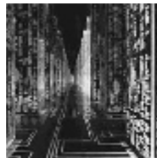
Figura 8: Ciudad virtual